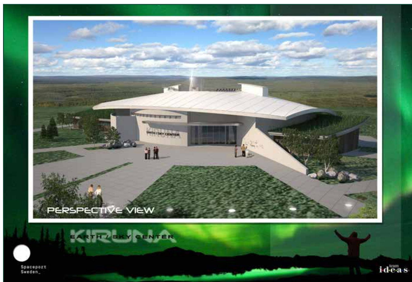
Kirunas nya teknik- och rymdupplevelsecentra Kiruna Earth Sky Center.

Tillväxtverket har, i uppdrag av regeringen, valt ut Kiruna i Swedish Lapland tack vare utvecklingen av rymd-