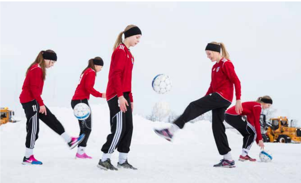
Snart landar FIFA World Cup Trophy på Lombia fotbollsplan i Kiruna, som kommer lysa grön och fin 1 mars. Kiruna FF:s fotbollsdamer är laddade!

TEXT: PETRA STERNLUND