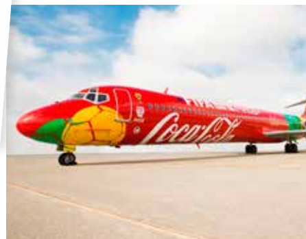
I ett specialchartrat plan landar VM-bucklan på Kiruna Airport, den 1 mars.

VM-bucklans besök i Kiruna är ett samarrangemang mellan FIFA, Coca-Co-